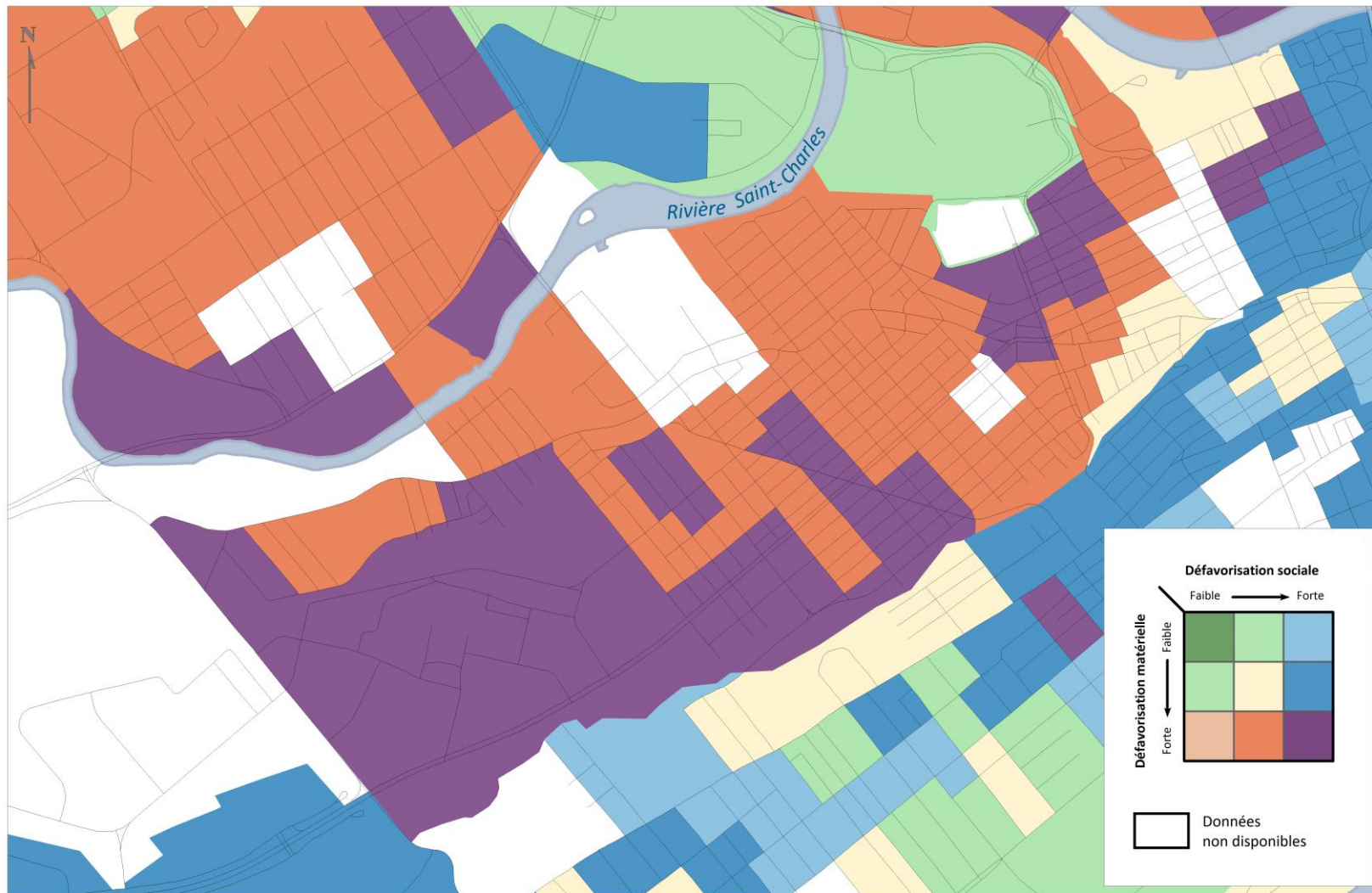
INDICE DE LA DÉFAVORISATION MATÉRIELLE ET SOCIALE - QUARTIER SAINT-SAUVEUR