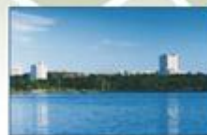
Université Laurentienne (Sudbury, Ontario)

Université Laurentienne Laurentian University