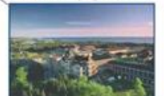
Université Sainte-Anne (Nouvelle-Écosse)