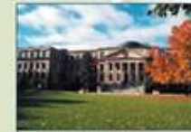
Université d'Ottawa (Ontario)

uOttawa L'Université canadienne Canada's university