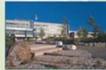
Collège Boréal (Sudbury, Ontario)