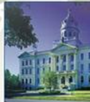
Collège universitaire de Saint-Boniface (Manitoba)