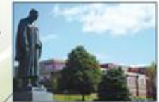
Université de Moncton (Nouveau-Brunswick)

UNIVERSITÉ DE MONCTON ÉDWARDEN MONCTON SHERBROOKE